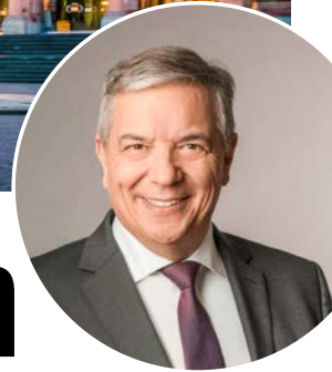
Gert-Uwe Mende, Oberbürgermeister Wiesbaden