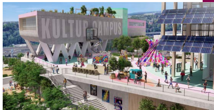
Noch existiert der KulturCampus Wiesbaden, der auch die Heimat eines Europäischen Hip-Hop-Museums sein soll, nur als Computerentwurf.

Nachhaltigkeit hat beim Schlachthof wenig mit grünem Zeitgeist zu tun. Auf eigene Initiative hat