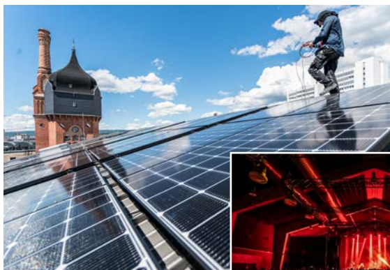
LED-Bühnenlicht und Photovoltaik – der Schlachthof setzt auf Nachhaltigkeit.

Auch mehr als drei Jahrzehnte nach seiner Gründung bleibt der Schlachthof Wiesbaden ein Fixpunkt der Stadtkultur.